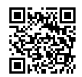
日本列島の地殻変動サイト

阪神淡路大震災後に整備されたGPSにより地殻変動が常時監視されており、国土地理院地殻変動情報表示サイトで見る事ができる。